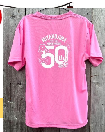
Tシャツイメージ(背面)